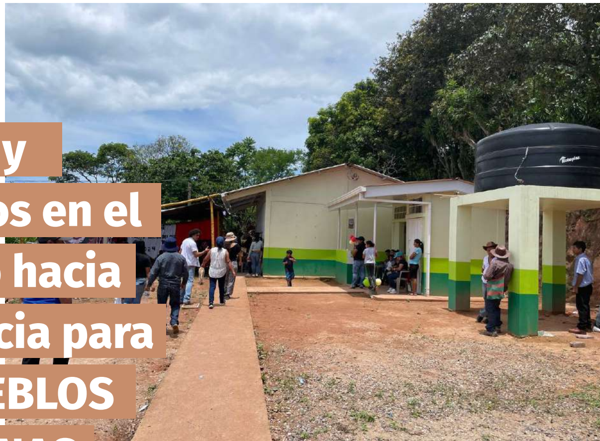
Inauguración del Jardín Infantil Felipe Zúniga en la comunidad de Pueblo Viejo de Colomocagua